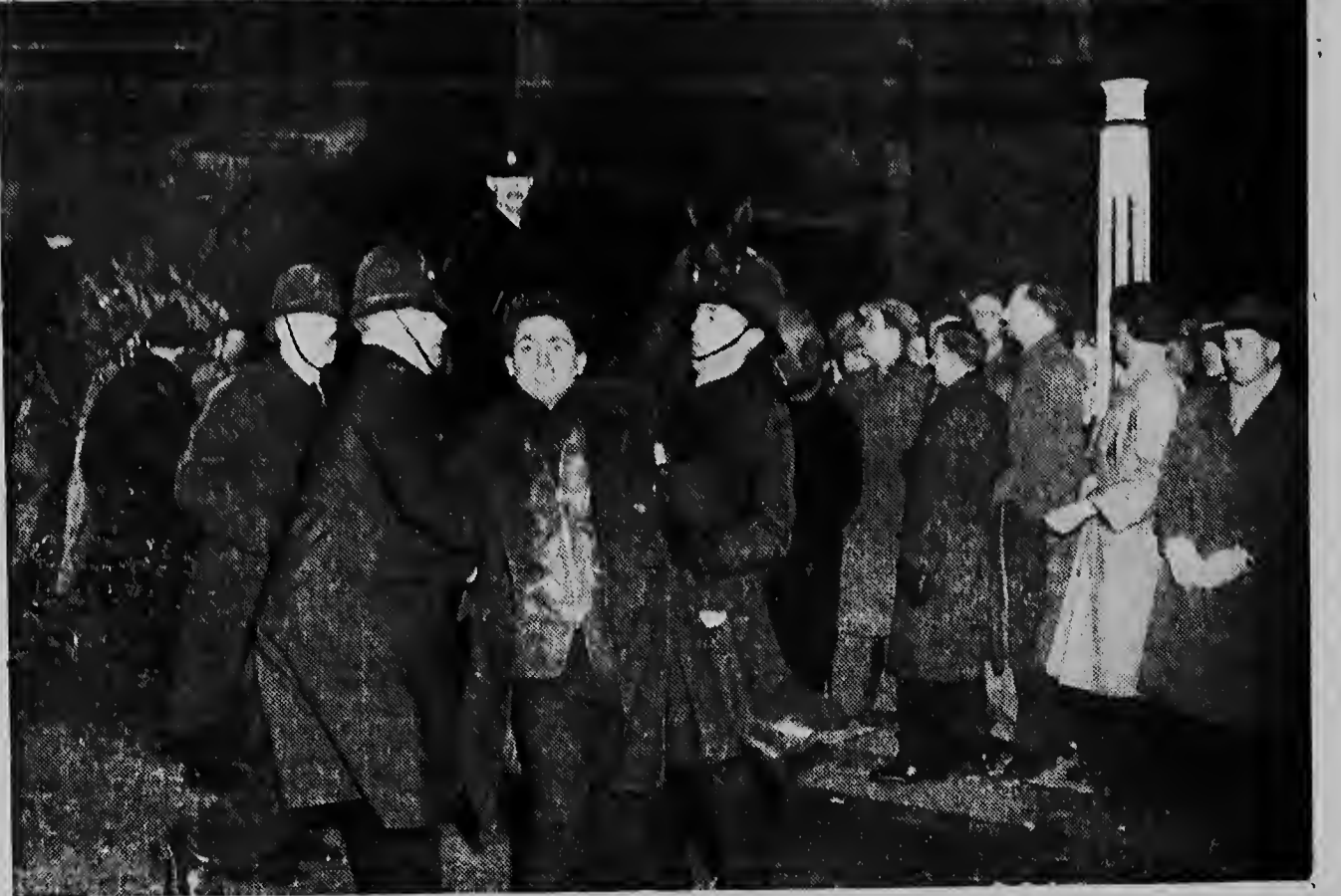
De Londense bereden politie heeft een grootscheepse charge uitgevoerd tegen duizenden demonstranten die zich verzameld hadden binnen de Engelse Parlementsgebouwen en die de uitgangen van het House of Commons, het Engelse Lagerhuis, wilden versperden, in protest tegen de Duitse herbewapening. De politie had eerst bevel gegeven tot het onttruimen van de St. Stephens ingang, maar de situatie spitste zich ernstig toe toen de politie met geweld de menigte uiteen moest drijven, terwijl de kreten „geen wapens voor de Duitsers“ niet van de lucht waren. Vele demonstranten waren lid van het Britse Vredescomité. Foto: Een arrestatie tijdens de rellen; drie van de honderden aanwezige Bobby's waren zich geducht....

WENEN.—De Amerikaan Noel Field en zijn vrouw Herta hebben het Amerikaanse gezantschap te Boedapest gisteren laten weten, dat zij besloten hebben zich definitief in Hongarije te vestigen. De Fields, die in Hongarije tot gevangenisstraffen wegens spionage waren veroordeeld, werden 16 November 1954 vrijgelaten en vroegen op 24 December asyl in Hongarije.